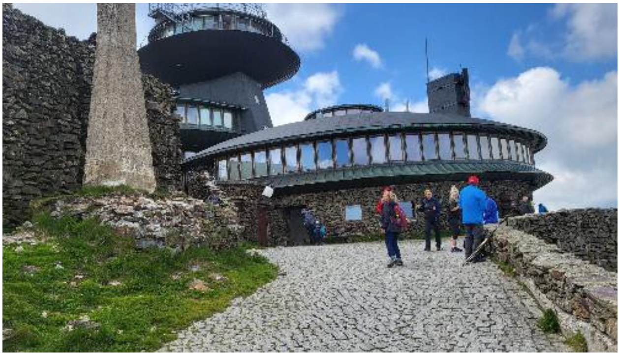
Na vrcholu Sněžky.