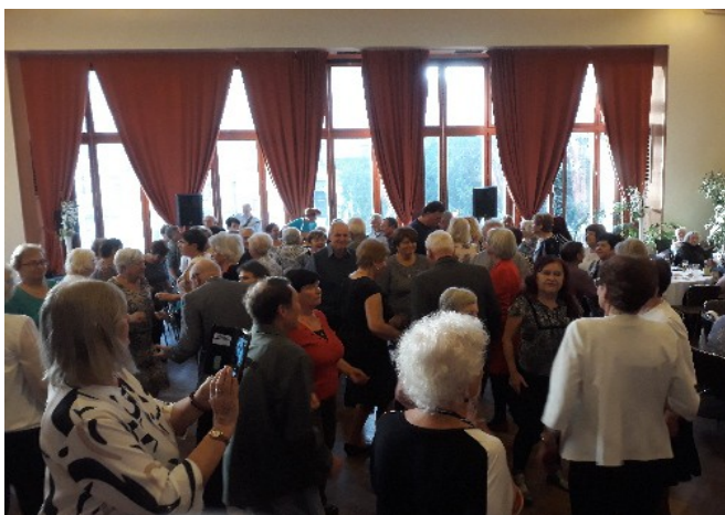
Plný parket mluví sám za sebe