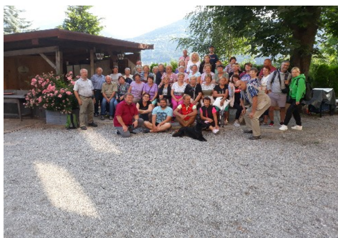
Kostelík nad Lavantem