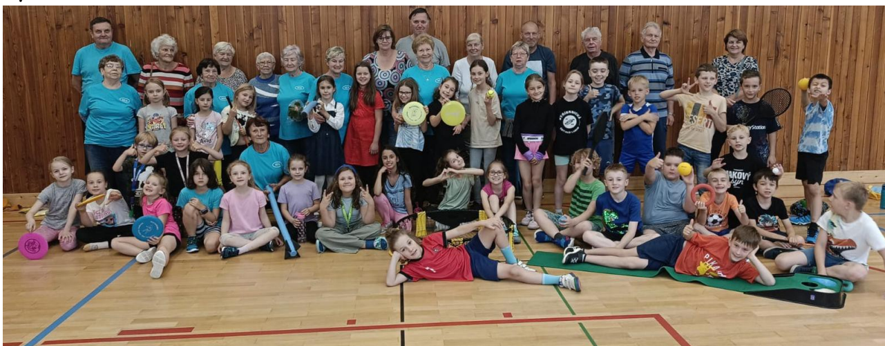
Společná fotografie seniorů s dětmi.