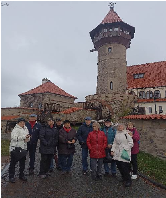
. Vrchol Hněvína