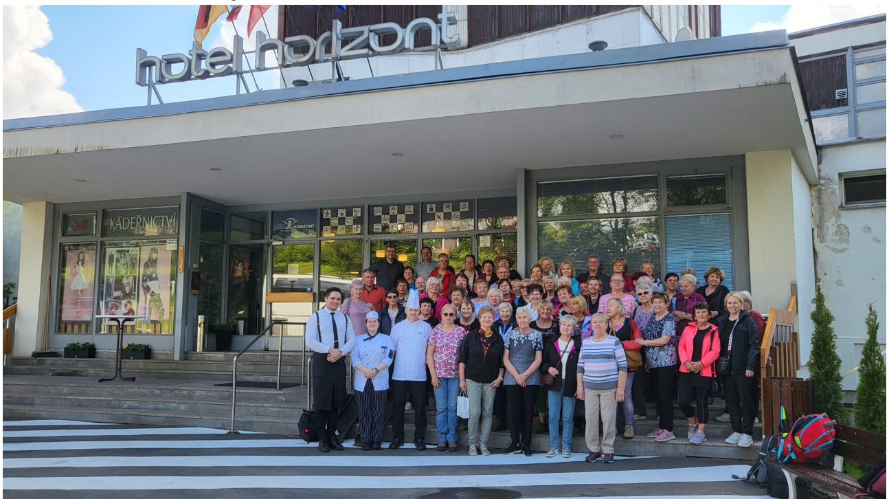
Před hotelem i s personálem.

Na základě spolupráce našeho Spolku se ŠD při ZŠ Stříbrnická nám připravili ve škole sportovní odpoledne. Toto, již tradiční, společné cvičení seniorů se žáky školy, patří k nezapomenutelným zážitkům všech účastníků. Pro nepřízeň počasí byly všechny disciplíny